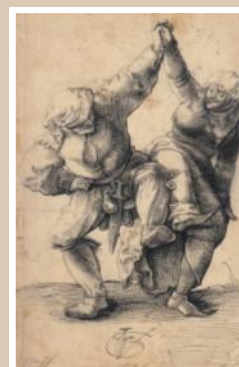
« Face à farces »

Le spectacle sera précédé de la présentation du message international par le Théâtre de l'Empreinte de Mériel. Cette année, l'auteur du Message de la Journée Mondiale du Théâtre 2015 est le metteur en scène polonais, Krzysztof Warlikowski. Le message sera disponible sur le site de l'Institut International du Théâtre très bientôt : http://www.iti-worldwide.org/fr/worldtheatreday.php