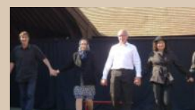
Théâtre de l'Essentiel